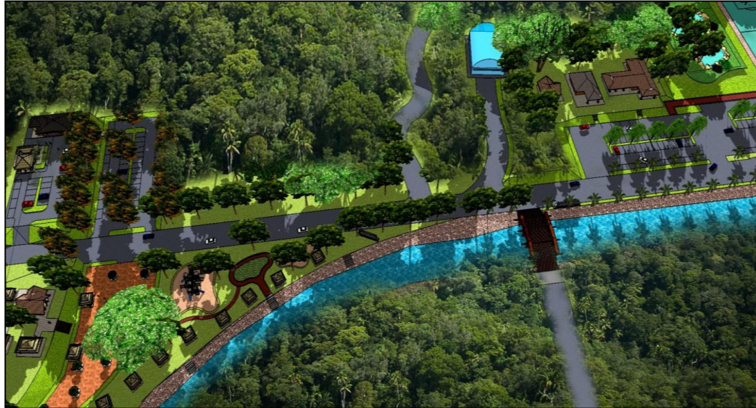
Foto 1.1 : Gambaran salah satu kawasan tindakan bagi cadangan pembangunan landskap di Kawasan Rekreasi Lembah Kiol