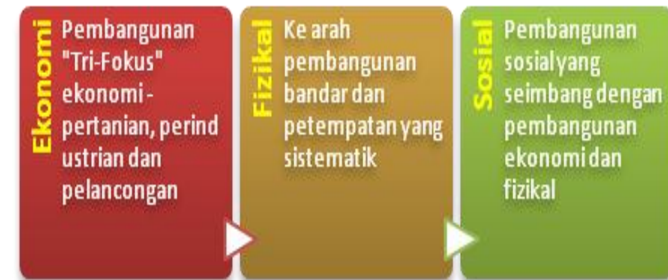
Rajah 2.1 : Objektif Pembangunan Negeri Pahang Sumber: Rancangan Struktur Negeri Pahang, 2002-2020

Strategi pembangunan negeri memfokus kepada pembangunan ekonomi dalam mana Rancangan Struktur Negeri Pahang 2002-2020 telah mensasarkan Strategi “Tri-Fokus” ekonomi. Menerusi strategi ini, pembangunan ekonomi yang tinggi dan stabil menjadi salah satu daripada agenda utama pembangunan mampan yang bakal dilaksanakan dengan penekanan kepada tiga sektor teras iaitu pertanian, perindustrian dan pelancongan. Ketiga-tiga sektor ini bakal berperanan sebagai pendorong ( impetus ) yang akan memperluas dan memantapkan lagi asas ekonomi negeri. Sasaran utamanya ialah menjadikan Pahang sebagai negeri pengeluar makanan utama negara, pusat perindustrian utama di Pantai Timur selain sebagai destinasi pelancongan sepanjang tahun.